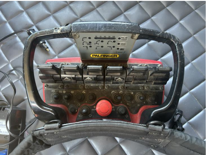
Le immagini mostrano in dettaglio le condizioni della gru e radiocomando